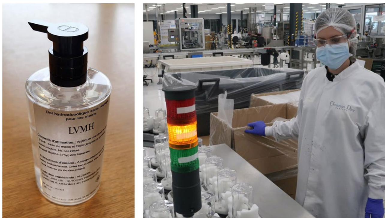
Le désinfectant pour les mains LVMH ont produit rapidement, au milieu de la pandémie par l'usine Christian Dior de Saint-Jean de Braye © LVMH. Images extraites du Financial Times ( www.ft.com )

Communiqué de presse de LVMH, 15 mars 2020.