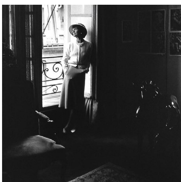
Gabrielle Chanel publié sur Instagram Chanel le 29 mars 2020 (@chanelofficial)

Communiqué de presse de Chanel, 29 mars 2020.