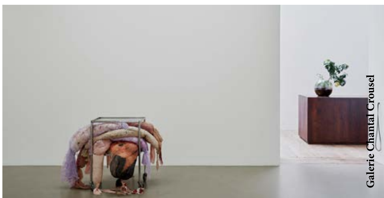
Galerie Chantal Crousel