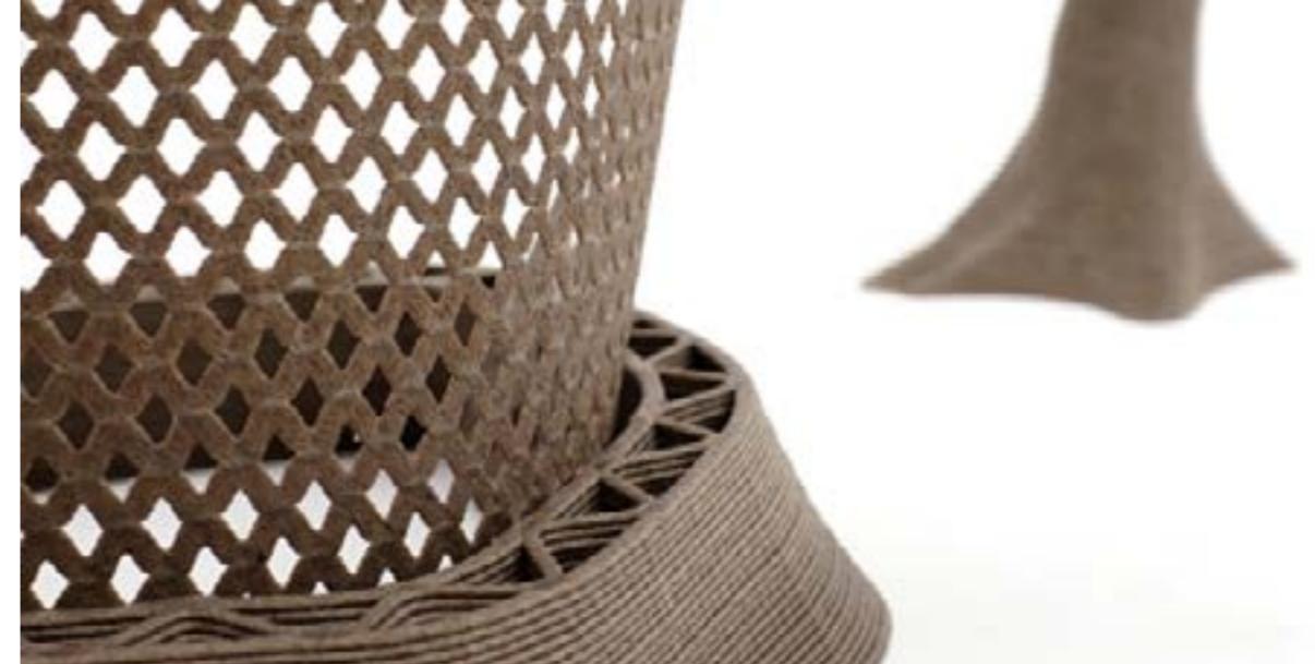
Différentes formes imprimées à partir d'imprimante 3D utilisant un mélange à base de 20% d' Ubiplast™ rendant le produit final Climate Positive, dans leurs couleurs neutres.

Nous avons réalisé de nombreux tests à base de granulés bruts ou colorés sur une imprimante 3D de très grand format permettant de réaliser des formes sculpturales géantes allant jusqu'à 1,5 mètre au cube d'un seul tenant. Nous avons également expérimenté la matière dans d'autres combinaisons pour l'exploiter en injection, thermoformage ou roto-moulage produisant des résultats qui ont dépassé toutes nos attentes. Ubiplast™ se révèle le matériau éco-innovant de choix pour de très nombreuses applications Retail telles que le Merchandising, la PLV ou la Décoration entre autres