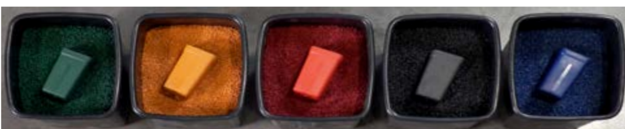
Exemples de formes et de couleurs générées sous forme de granules, toutes Climate positives. Des couleurs peuvent être produites pour des projets sur mesure. La trace carbone finale sera déterminée à partir du mélange utilisé à cet effet.

Nous avons réalisé de nombreux tests à base de granulés bruts ou colorés sur une imprimante 3D de très grand format permettant de réaliser des formes sculpturales géantes allant jusqu'à 1,5 mètre au cube d'un seul tenant. Nous avons également expérimenté la matière dans d'autres combinaisons pour l'exploiter en injection, thermoformage ou roto-moulage produisant des résultats qui ont dépassé toutes nos attentes. Ubiplast™ se révèle le matériau éco-innovant de choix pour de très nombreuses applications Retail telles que le Merchandising, la PLV ou la Décoration entre autres