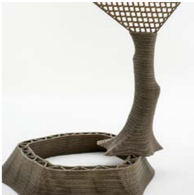
Several forms printed using a 3D printer using a mixture that incorporates 20% Ubiplast™ making the final printed product Climate Positive, in its neutral color

Après 3 mois de privation sociale, le déconfinement nous a ramenés quelques étapes en arrière, vers une redéfinition de la normalité, prêts à redécouvrir l'expérience exaltante de nos villes, assainies et régénérées. Comme vous, nous nous sommes plongés dans un mode introspectif, laissant germer un désir accru d'épurer nos pratiques industrielles et notre offre produit. En espérant évidemment converger vers les nouvelles attentes de nos clients. En effet, nous avons tous ensemble été sensibilisés à consommer plus local et à reconsidérer cette facilité devenue trop évidente de nous appuyer sur des ressources à l'autre bout du monde. Pourtant, basés à Paris, au cœur de l'Europe et à proximité des plus grands commanditaires du luxe nous sommes idéalement placés pour réagir immédiatement aux besoins du marché avec une proposition de valeur unique alliant originalité, technicité et efficacité dans la création d'expériences fortes et de matériaux uniques au service des marques.