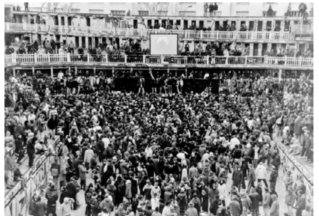
Heretik Sound System à Hôtel Molitor, Paris, 2001