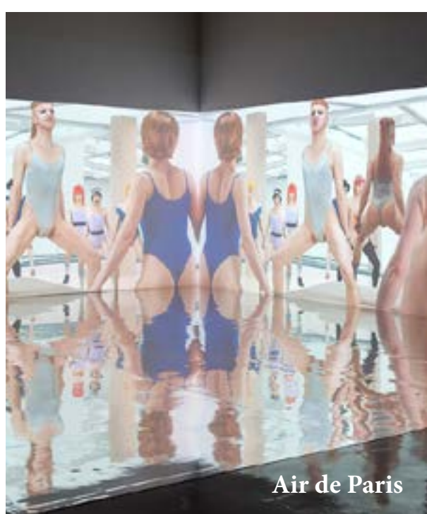
Air de Paris

Notre appétit d'Expérience Artistique n'a jamais été aussi énorme. Malgré toute l'énergie et l'imagination qui se sont invitées dans les alternatives online, rien ne remplace la présence "matérielle" de l'Art. Les expositions virtuelles, les showrooms en ligne et les présentations vidéo ne seront toujours qu'illusions, substituts frustrants de l'expérience réelle. L'Art est une activité sensorielle, corporelle parfois qui occupe l'espace réel et nous avons souffert de ce sevrage de créations matérielles et d'Expériences Artistiques.